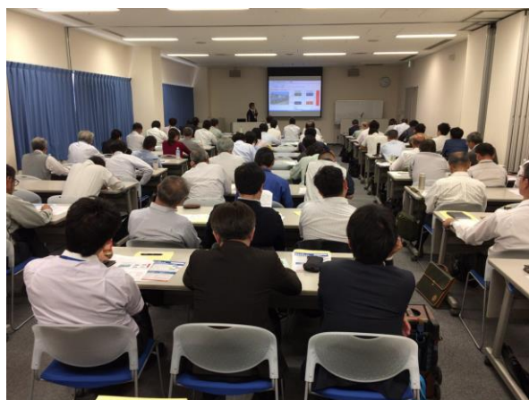
県委託セミナーの様子