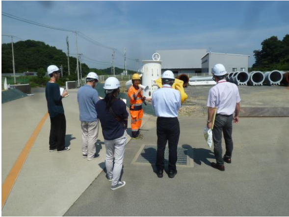
会川鉄工(株)視察の様子

● 令和元年8/8(木)～9(金)開催 福島県再エネスタディツアー～再エネまんぷく編～