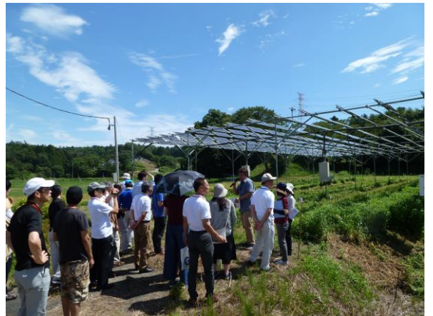
えこえね南相馬ソーラーヴィレッジ視察の様子