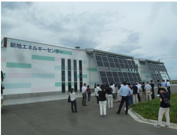
新地エネルギーセンター視察の様子